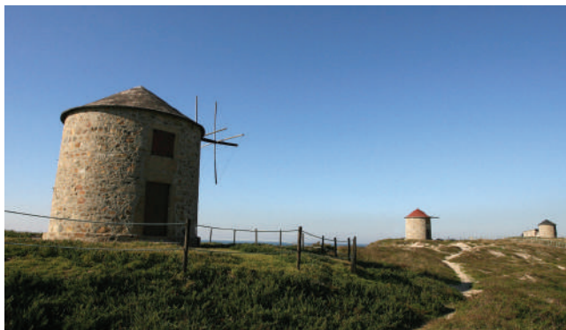
MOINHOS DE VENTO