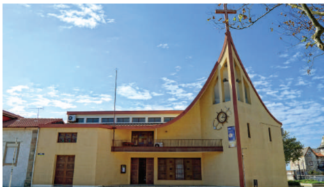
CAPELA DA SR.ª DA GUIA