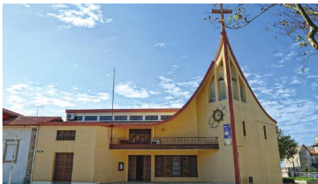
CAPELA DA SR.ª DA GUIA