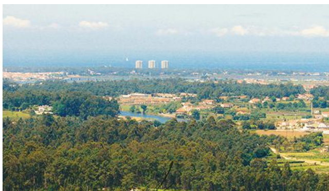
MIRADOURO DE ARNELAS