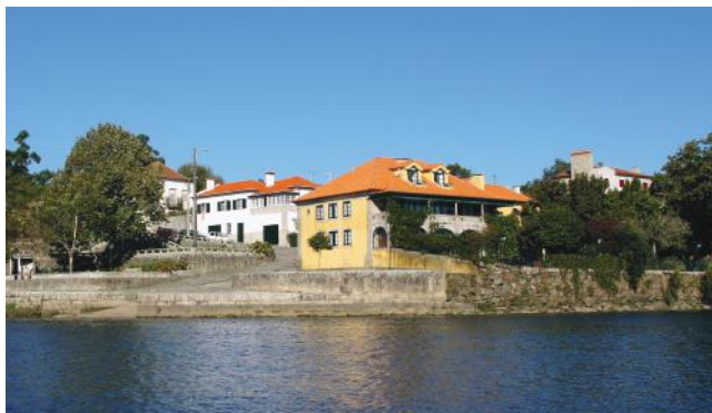
BARCA DO LAGO