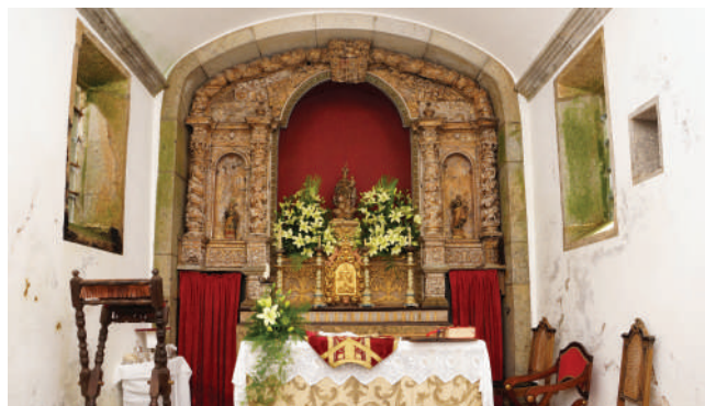
CAPELA NOSSA SENHORA DO ROSÁRIO