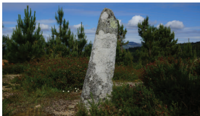
MENIR DE ANTAS