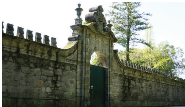
QUINTA DE BELINHO