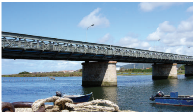
PONTE LUÍS FILIPE