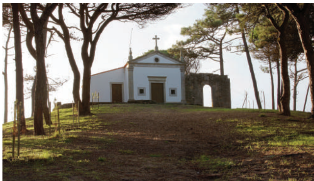
CAPELA E FACHO DA BONANÇA